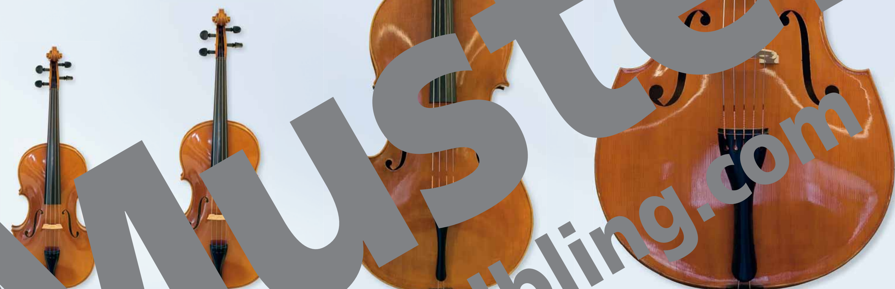
Violine I (Geige) Violine II (Geige) Viola Kontrabass (Bass)

Für das Streichquartett (zwei Violinen, eine Viola, ein Violoncello) wurden ab der Wiener Klassik viele bedeutende Werke geschrieben.