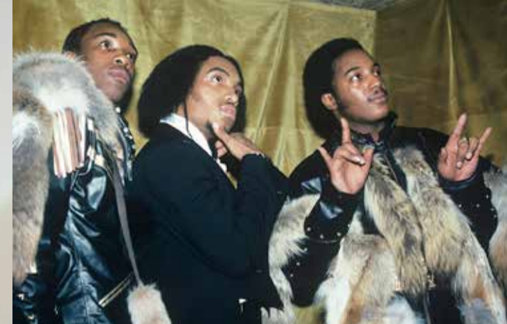
Grandmaster Flash & The Furious Five

Der Hip-Hop entwickelte sich in den Ghettos der amerikanischen Großstädte und basiert auf dem Rap (Sprechgesang). Hip-Hop gibt es auch im Tanz und in der Graffiti-Kunst.